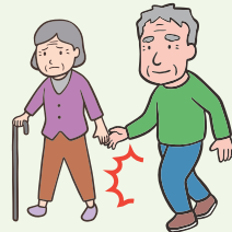
● 休まず歩き続ける