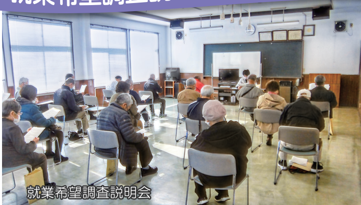
就業希望調査説明会