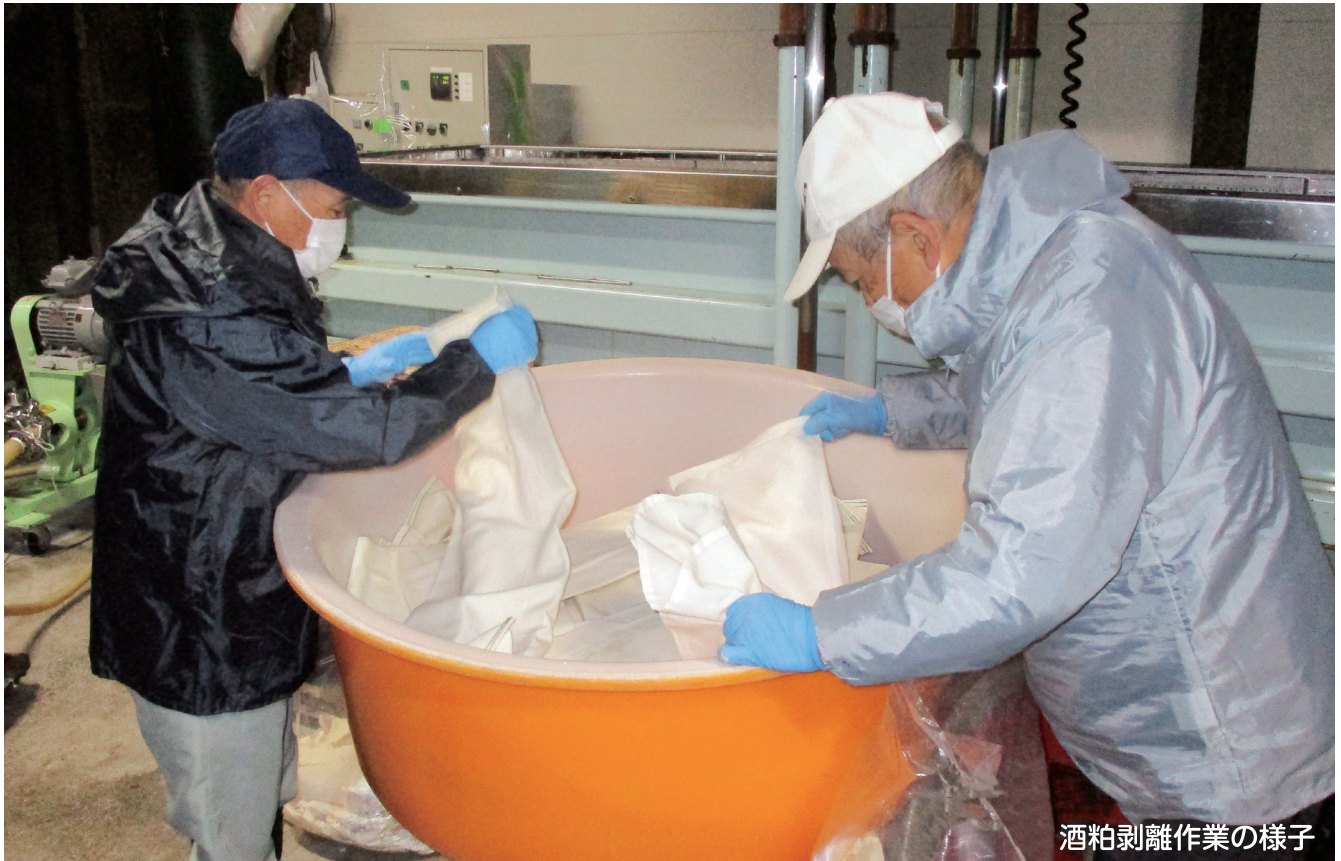
酒粕剥離作業の様子

発行日 令和7年2月1日 発行所 公益社団法人 大田原市シルバー人材センター 事務所 大田原市住吉町1丁目9番37号 TEL (0287) 23-1255 編集 会報編集委員会 ホームページ https://www.ohtawarasc.or.jp/