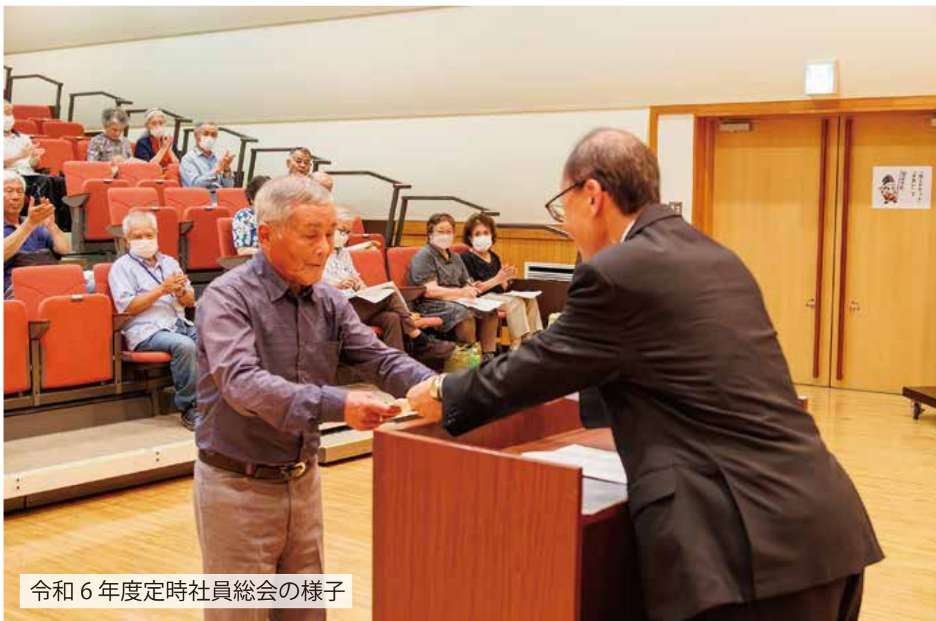
令和6年度定時社員総会の様子